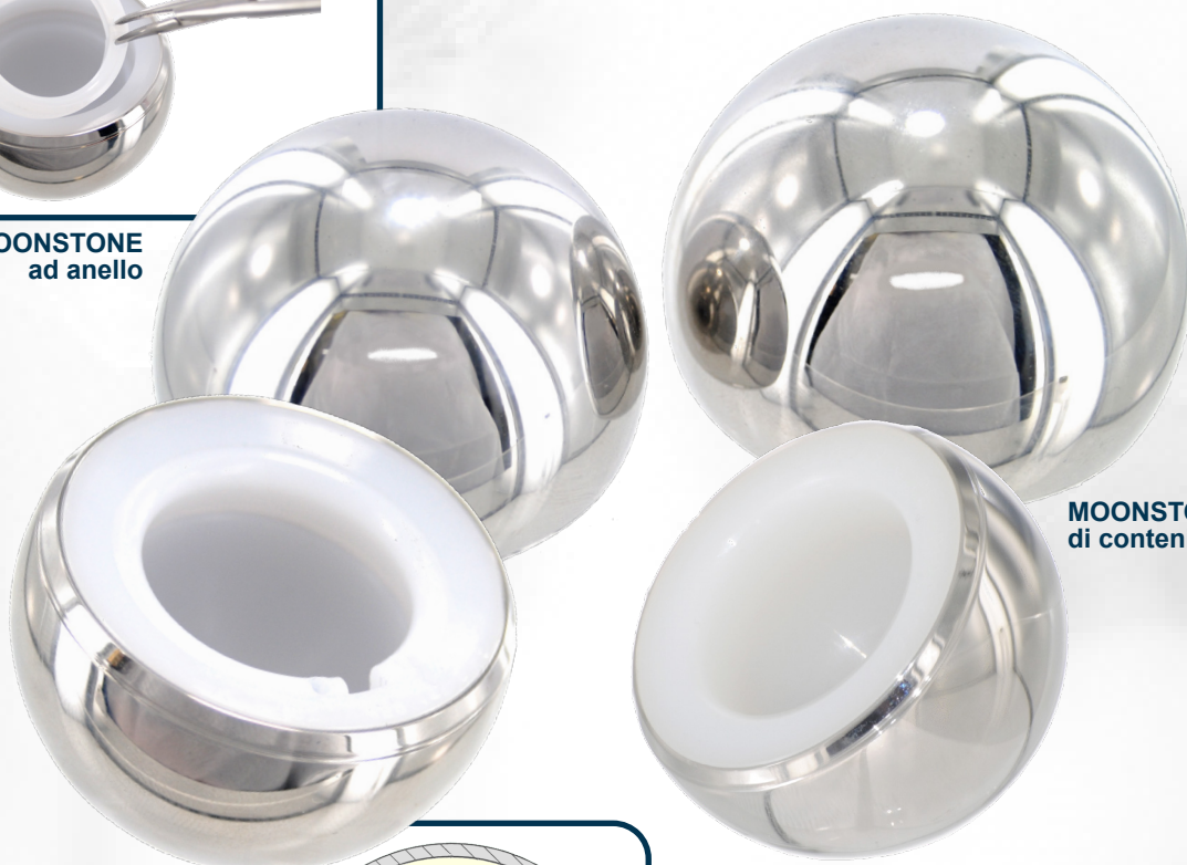
MOONSTONE di contenimento