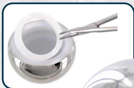
MOONSTONE ad anello