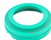
Réducteur d'impaction pour insert Ø36mm Impactation reducer for Ø36mm insert H76 021